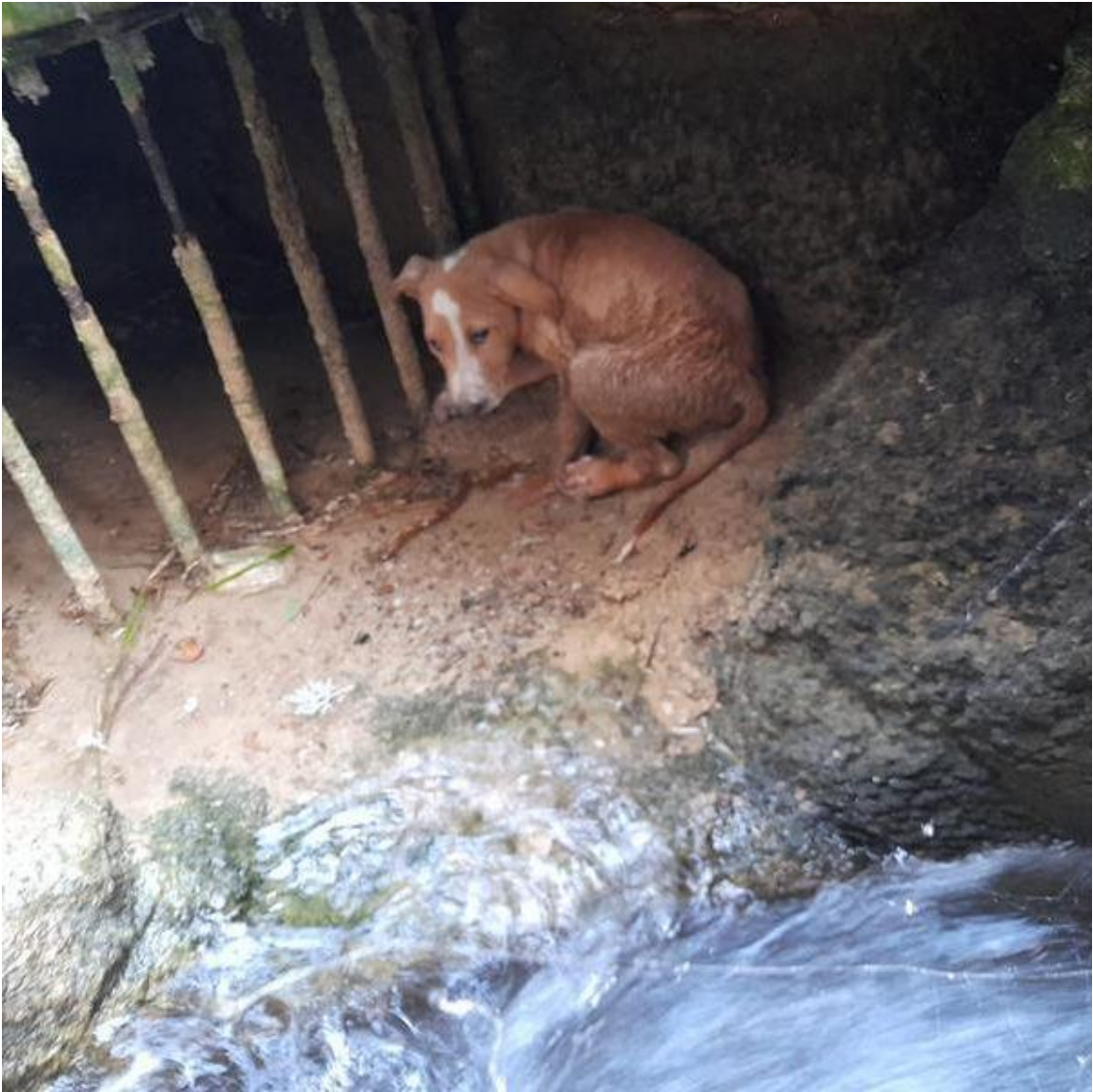
Hier war Elmo tagelang gefangen: zwischen kaltem Wasser, klitschigen Felsen und Betonwänden.