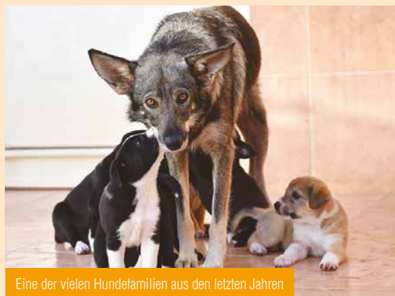
Eine der vielen Hundefamilien aus den letzten Jahren