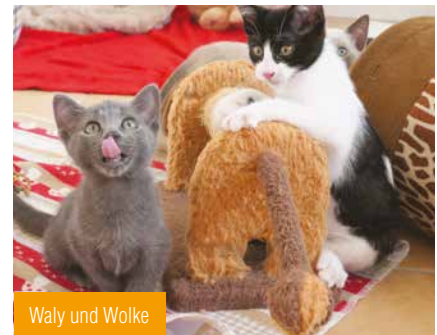
Waly und Wolke

also nicht an den Knochen zu liegen. Jetzt stehen weitere Untersuchungen an, um herauszufinden, was genau das Problem ist. Und das wird wieder teuer, denn die normale Tierklinik kann da nicht weiterhelfen – wir müssen