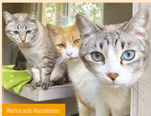
Warten aufs Abendessen