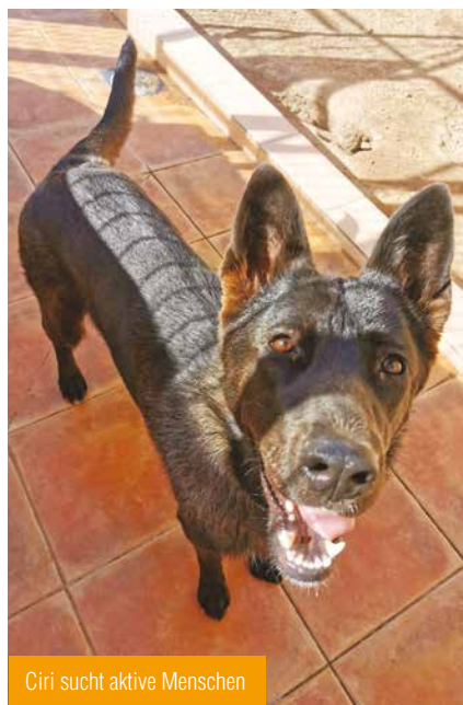
Ciri sucht aktive Menschen

Ozuna ist auch noch relativ ängstlich, aber sie macht keinerlei Probleme. Sie ist eine ganz liebe und schüchterne Maus, die mindestens schon einmal Welpen bekommen hat. Als sie bei uns ankam, war sie gerade läufig. Wir werden sie jetzt schnellstmöglich kastrieren, damit ihr weitere Schwangerschaften erspart bleiben.