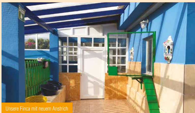
Unsere Finca mit neuem Anstrich