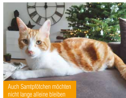
Auch Samtpfötchen möchten nicht lange alleine bleiben

Sämtliche Kosten (Futter, Medizin, Impfung, Kastration) übernimmt natürlich die Arche. Für Sie entstehen keine Kosten. Es wäre uns aber eine große Hilfe, wenn Sie nötige Tierarztbesuche ggf. eigenständig übernehmen könnten. Wichtig ist natürlich auch, dass bei Mietwohnungen das Ok des Vermieters zur Tierhaltung vorliegt. Wenn Sie Lust haben, uns bei der Vermittlung unserer Hunde und Katzen tatkräftig zu unterstützen, dann melden Sie sich bei uns. Wir würden uns riesig freuen, auf diesem Wege die eine oder andere Pflegestelle zu finden.