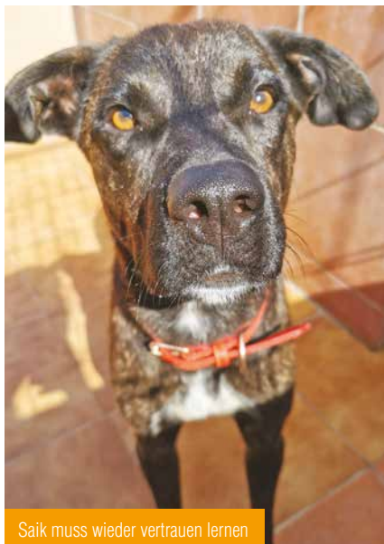
Saik muss wieder vertrauen lernen

Die Besitzverhältnisse der zwei Hunde waren ebenfalls sehr dubios und am Ende nicht mehr nachvollziehbar. Denn laut der Chips der beiden waren sie gar nicht auf die angebliche