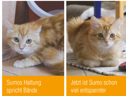
Sumos Haltung spricht Bände