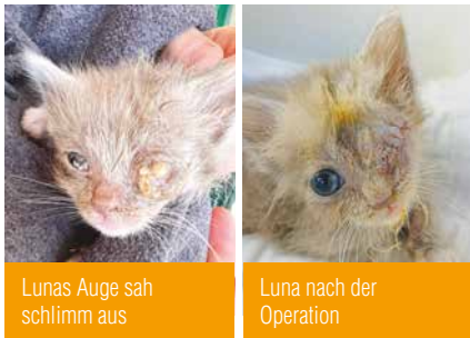
Lunas Auge sah schlimm aus

Natürlich haben auch wieder viele Kätzchen den Weg zu uns gefunden, eines von ihnen war Luna . Sie wurde mutterseelenalleine von Touristen auf der Straße gefunden. Es waren weit und breit keine Geschwister oder eine Katzenmama in Sicht. Die Finder brachten die Kleine in ihrer Not zu uns ins Tierheim. Wir schätzten sie auf knapp 4 Wochen. Ihre Augen waren total entzündet, vor allem das linke. Es sah furchtbar aus – total zugeschwollen und voller Eiter.