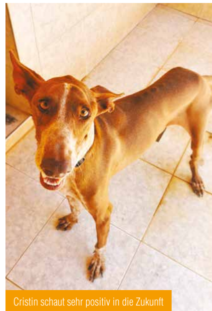
Cristin schaut sehr positiv in die Zukunft

Und auch Ciri wurde wegen Zeitmangels bei uns abgegeben. Die gerade einmal einjährige, wunderhübsche Hündin war täglich neun Stunden alleine und nahm wohl die ganze Wohnung auseinander. Scheinbar durfte sie nicht mal Gassigehen, denn sie lief anfangs furchtbar schlecht an der Leine. Das klappt inzwischen aber viel besser und sie ist ein echter Schatz, der noch etwas Erziehung benötigt. Ciri sucht jetzt dringend sportliche Menschen, die viel mit ihr unternehmen, sie auslasten und ihr das Hunde-ABC beibringen.