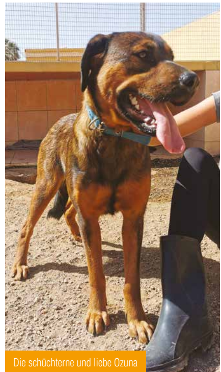
Die schüchterne und liebe Ozuna

Die beiden Vierbeiner Ozuna (2 Jahre) und Saik (1 Jahr) sind da schon ein anderes Kaliber. Sie lebten bei einer Spanierin auf dem Sonnendach und kamen wohl nie vor die Tür. Es ist immer wieder erstaunlich, wie viele