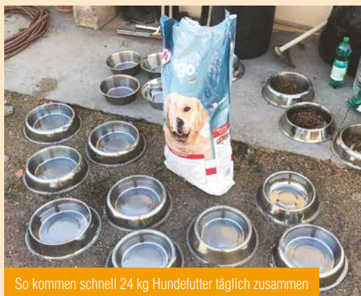
So kommen schnell 24 kg Hundefutter täglich zusammen