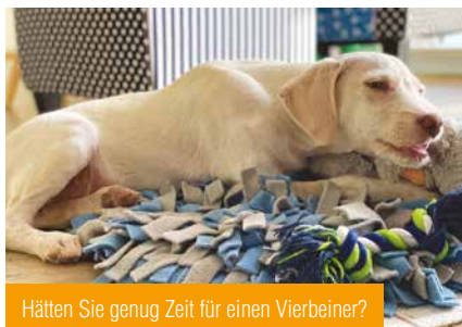
Hätten Sie genug Zeit für einen Vierbeiner?

Aufgrund der vielen Tiere bei uns im Tierheim suchen wir dringender als jemals zuvor Pflegestellen in Deutschland. Wir haben so viele Kätzchen und kaum noch Platz für Neuzugänge, dass wir dringend einige Samtpfötchen ausfliegen müssten. Leider sind unsere Pflegestellen in Bensheim und Heppenheim aber immer noch voll besetzt, sodass wir dort keine weiteren unterbringen können. Und auch für einige unserer Hunde wäre es so wichtig, endlich in einem Haushalt zu leben und die zivilisierte Welt kennenzulernen. Gerade diejenigen, die noch jung, aber schon lange bei uns sind, brauchen endlich eine Chance, zu lernen und sich weiterzuentwickeln. Das ist im Tierheim schlichtweg nicht möglich. Natürlich haben wir gewisse Anforderungen an Pflegestellen. Deshalb ist es nicht immer leicht, passende zu finden. Aufgrund der ganzen Administration, die dahintersteckt, kom-